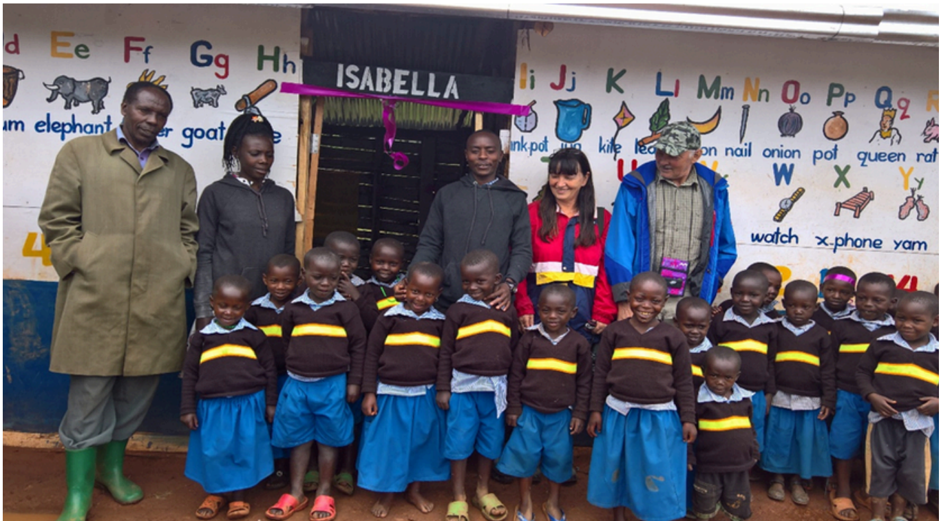
Die erste Klasse im Jahr 2018

Wichtig! Beim Verwendungszweck immer die Ortsgruppe und den Spendenzweck angeben