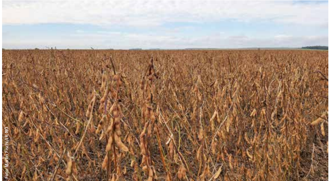
Die Marktperspektiven für Biosoja sind nach wie vor sehr gut – sowohl für Speise- als auch für Futtersoja.