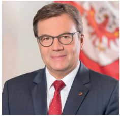
Landeshauptmann Günther Platter

„Unsere Almen sind unverzichtbar und müssen als Erholungs- und Wirtschaftsraum erhalten bleiben. Dafür wollen wir das Bewusstsein stärken, dass es dort Regeln gibt – zur eigenen Sicherheit sowie zum Schutz von Tier und Natur.“